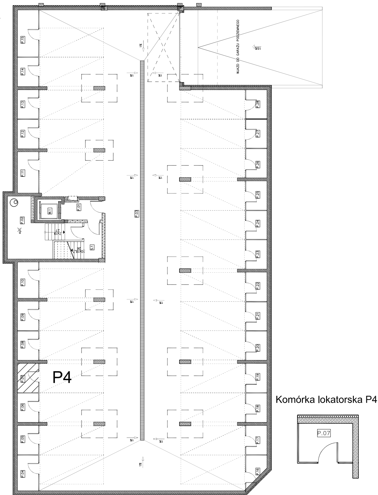
Komórka lokatorska P4