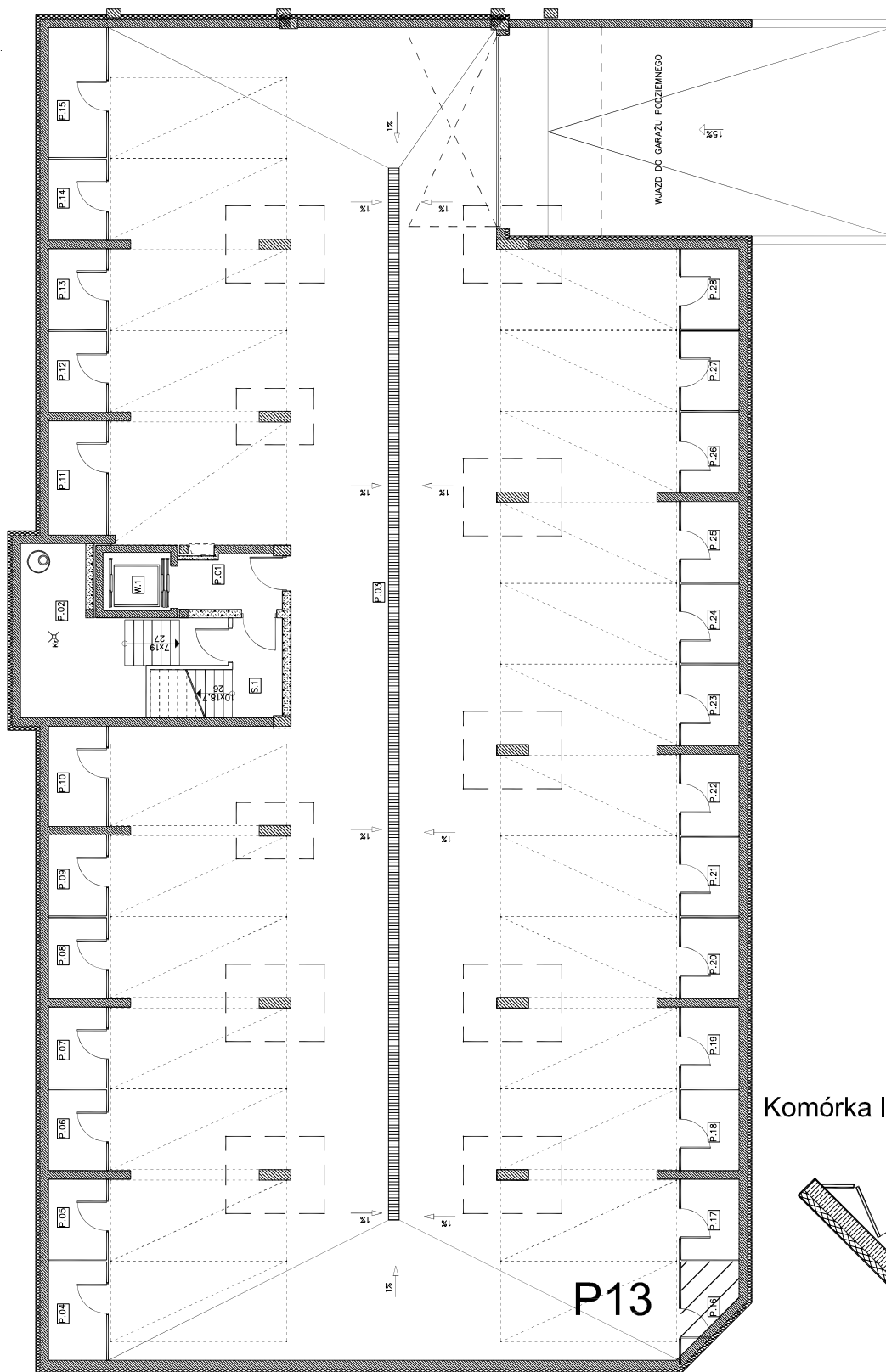
Komórka lokatorska P13